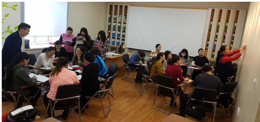
Фото зураг 1. ”Мини” хичээлийн үйл явц

Оюутан хичээлийн сэдэв /хамтрагч/, хичээл заах цаг хугацаагаа сонгосон байх ёстой. Хэрэв хүндэтгэн үзэх шалтгаанаар хичээлийг цагт нь зохион байгуулах боломжгүй болсон тохиолдолд семинарын багшид болоод бүлгийн оюутнуудад