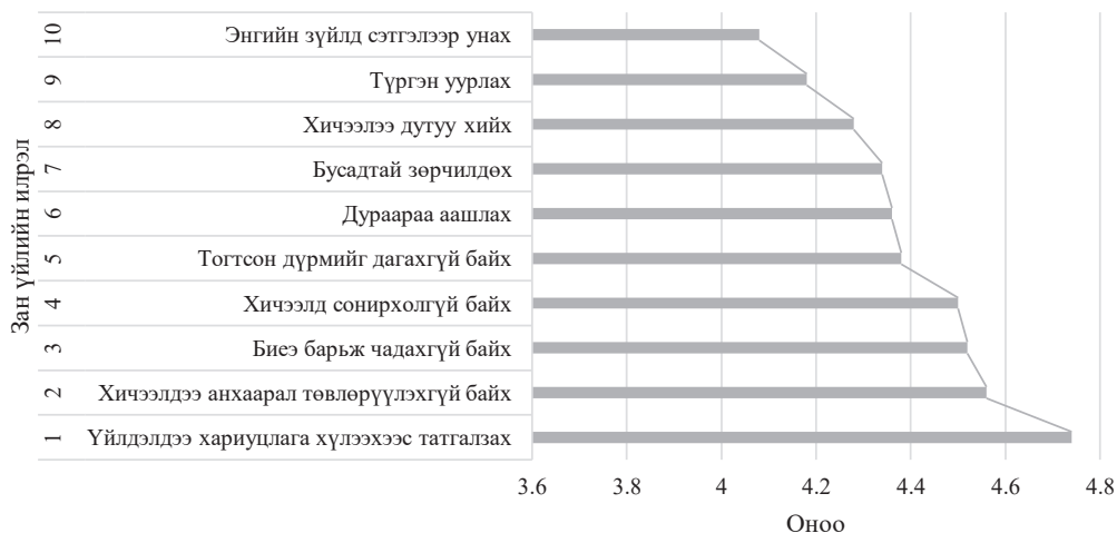
График 2. Зан үйлийн давтамжийн дундаж үзүүлэлт

Сурагчдын зан үйлийн дундаж онооны шинжилгээний үр дүнгээс харахад хамгийн өндөр оноо буюу 4.74-ийг “үйлдэлдээ хариуцлага хүлээхээс татгалзах” үзүүлэлт эзэлж байгаа нь хүүхдүүд өөрийн үйлдэл, үүрэг, алдаандаа хариуцлагагүй хандах, бусдад тохих хандлага давамгайл байгааг илтгэнэ. Энэхүү зан үйл нь бусад сөрөг зан