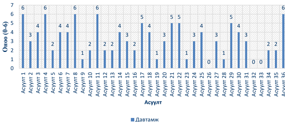
Айберг-ийн 36 асуулгын давтамжийн график

Графикийн статистик дүн шинжилгээгээр зан үйлийн зарим асуултууд өндөр давтамжтай илэрчээ. Бандурагийн «Нийгмийн суралцах онол» (Social Learning Theory)-оор тайлбарлахад, өндөр давтамжтай зан үйл (жишээ: №4, №12) нь ихэвчлэн гэр орчин болон цэцэрлэгт даган дуурайх замаар суралцсан зан үйл байж болзошгүй. Эцэг эхийн зан төрх, багшийн загвар үзүүлэлт нь хүүхдийн зан үйлд шууд нөлөөлдөг (Bandura, 1977). Ихэнх хүүхдүүдийн зан үйлийн үнэлгээний оноо 3–4 онооны хооронд (75) тархсан нь ердийн хөгжлийн хэв шинжтэй нийцэж байна.